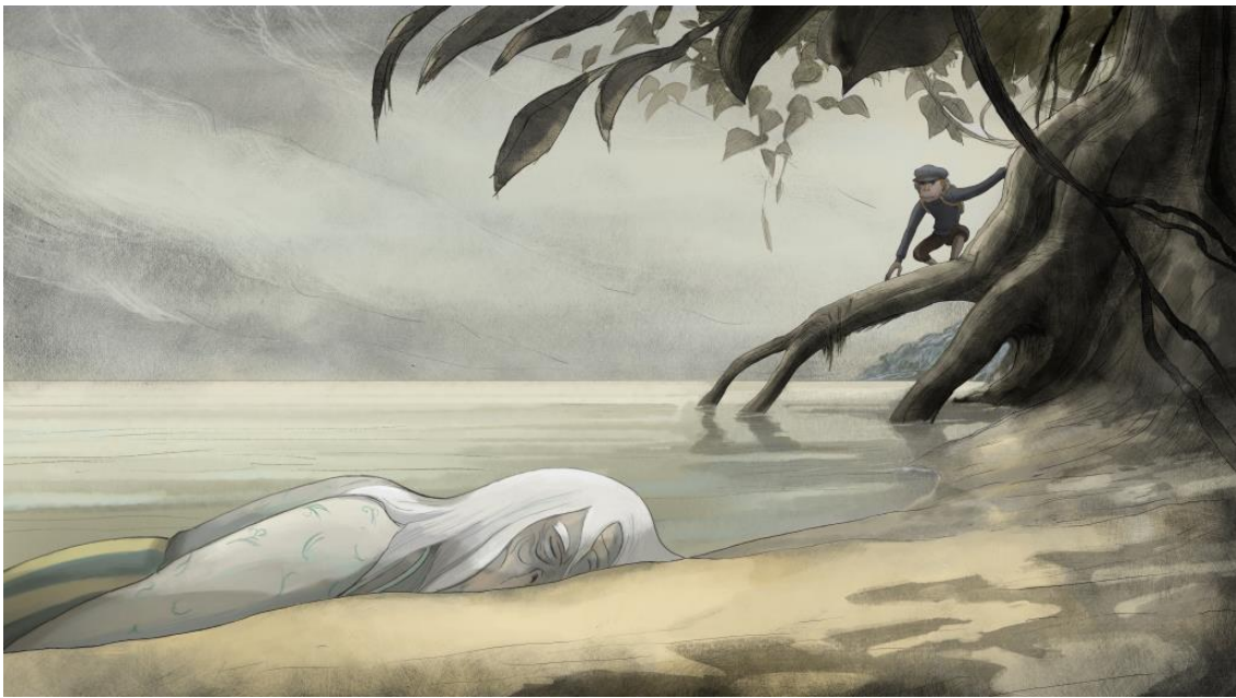
Figure 2. Le prince échoué © Jean-François Laguionie

Le prince des lankoos est échoué sur un rivage (Fig. 2), sur l'autre rive du lac, en face de son pays, suite à la rupture des glaces. Il est recueilli par des nioukos, singes de la ville, scientifiques. Tom, leur fils adoptif, comprend sa langue et s'occupe de lui. Il lui fait visiter Nioutone (Fig. 3), faite d'immeubles, de tramways et d'ouvriers à la chaîne.