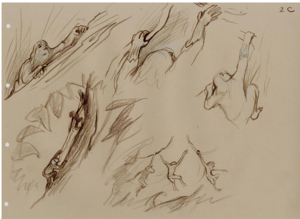
Figure 7. Circuler © Jean-François Laguionie

« Ces découpes de branches et de feuilles, ces bifurcations, ces lobes, ces touffes, fouillis menu et innombrable ; ce ciel dont on ne voyait que des éclaboussures ou des pans irréguliers ; tout cela existait peut-être seulement pour que mon frère y circulât de son léger pas d'écureuil. C'était une broderie faite sur du néant, comme ce filet d'encre que je viens de laisser couler, page après page. » (Calvino, 1957)