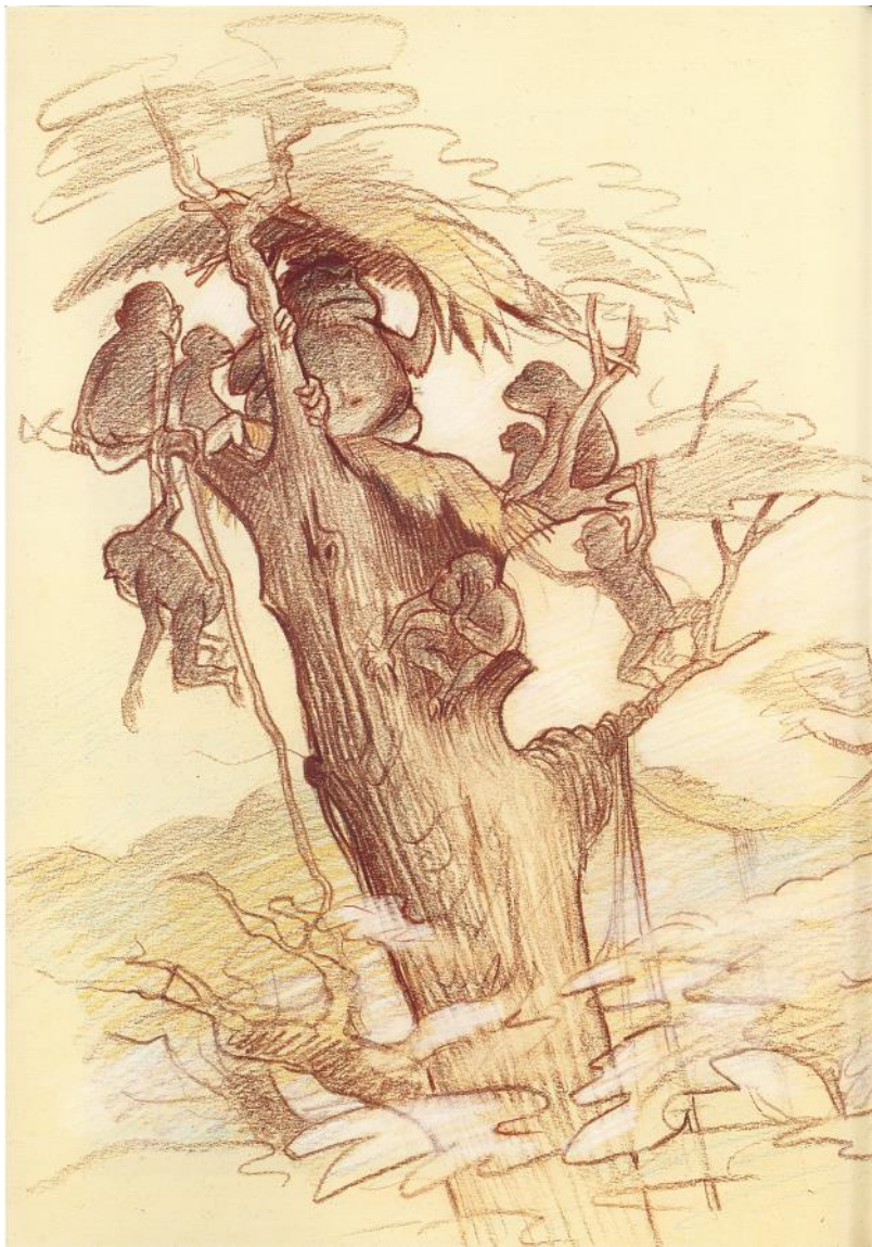
Figure 9. Arborée. Jean-François Laguionie ( Salachas , 1992)

Le jeune Kom, vivant sur la canopée, désobéit et tombe inconscient sur des fougères, plantes salvatrices. (Laguionie, 1999)