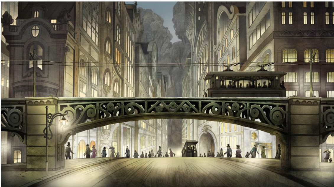
Figure 3. Nioutone © Jean-François Laguionie

Le prince des lankoos est échoué sur un rivage (Fig. 2), sur l'autre rive du lac, en face de son pays, suite à la rupture des glaces. Il est recueilli par des nioukos, singes de la ville, scientifiques. Tom, leur fils adoptif, comprend sa langue et s'occupe de lui. Il lui fait visiter Nioutone (Fig. 3), faite d'immeubles, de tramways et d'ouvriers à la chaîne.