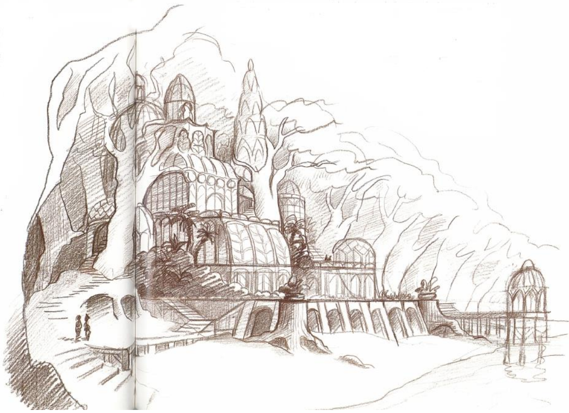
Figure 12. Jean-François Laguionie (Salachas, 1992)