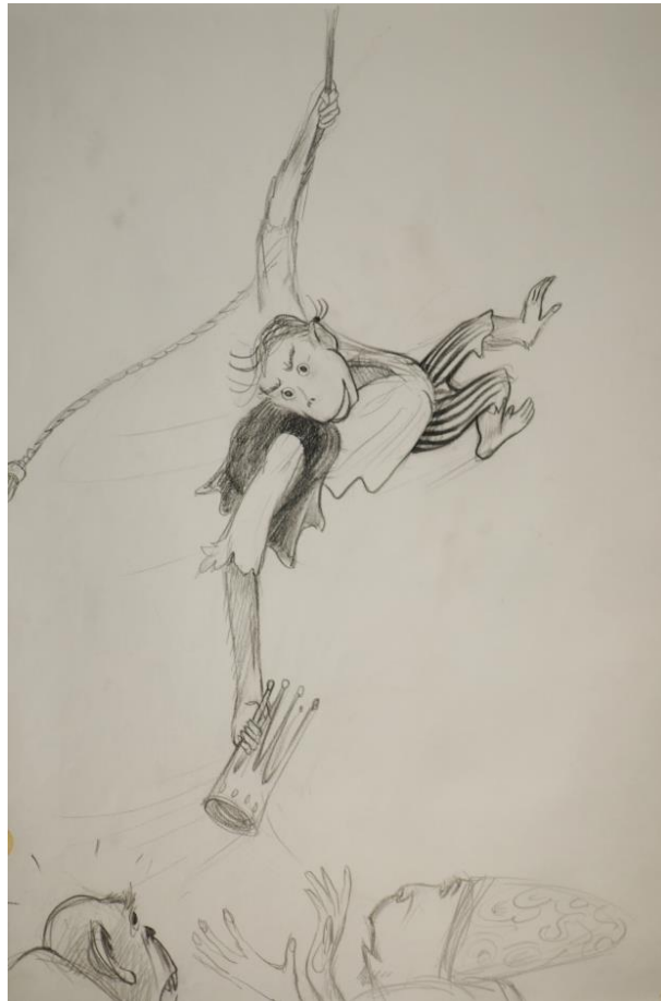
Figure 1. Un sauvage à éduquer © Jean-François Laguionie

Une communauté de singes est séparée en deux par un tsunami. Les laankos restent au sol, les woonkos dans la canopée : ils s'oublent mutuellement. Un jeune woonko, Kom, brave l'interdit du monde d'en bas, tombe, sa chute est amortie par des fougères. Le prince des laankos le sauve des intentions meurtrières de ses compagnons de chasse. Chez les laankos, il devient un sauvage à éduquer (Fig. 1).