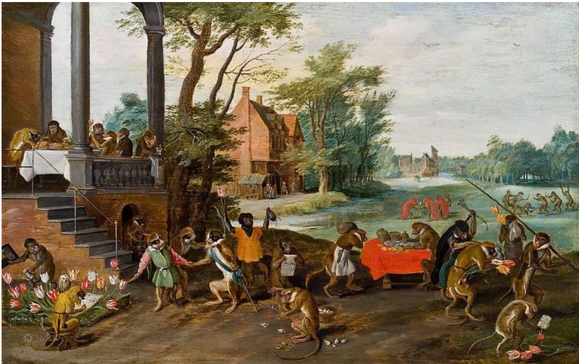
Figure 5. Allégorie de la tulipomania, Jan Brueghel le Jeune, env. 1640

Les définitions de la transaction proposées ici font apparaître des sens qui s'écartent de l'usage actuel de ce mot. Celui-ci est en effet généralement restreint à des considérations commerciales (Fig. 5, "singes en transaction").