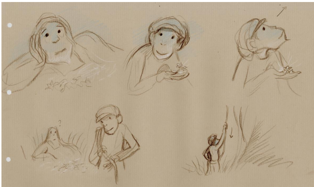
Figure 10. Fleurs et pétales du berceau © Jean-François Laguionie

Tom : « J'aimerais bien les aider à comprendre le langage des arbres » (Laguionie, 2019)