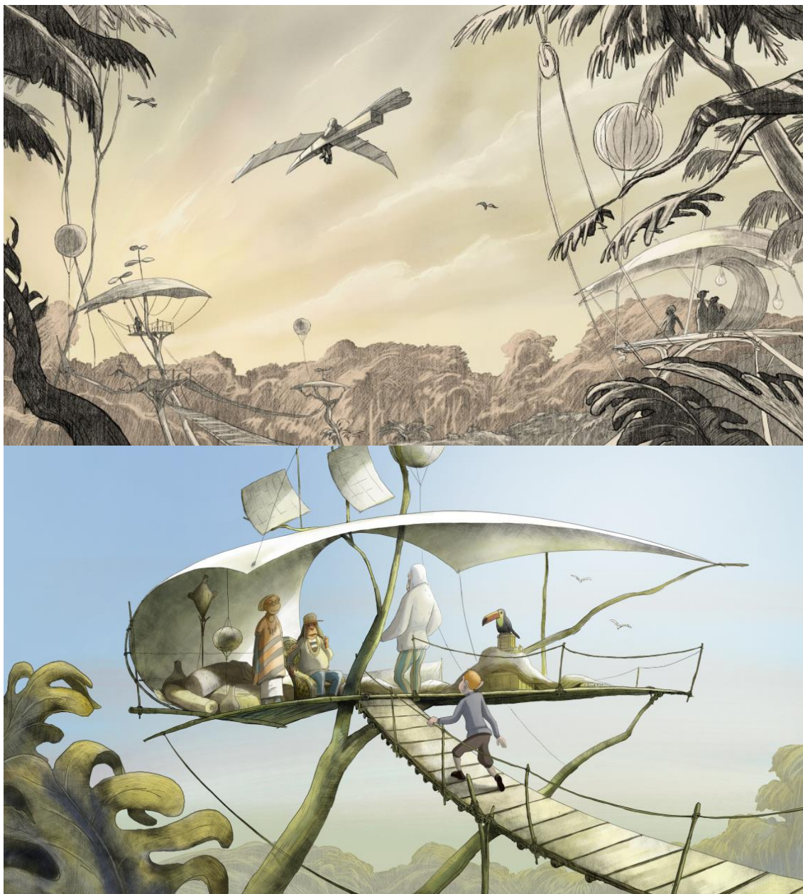
Figure 4. La canopée © Jean-François Laguionie

Métaphore végétale, les décors sont ici plantés . À travers ce dernier film «Le voyage du Prince », le film précédent qui lui est lié, « Le château des singes » et le livre antérieur qui a inspiré leur réalisateur « Le baron perché », nous voudrions montrer et illustrer comment les plantes et certains primates sont en transactions , de quelles manières ces transactions s'expriment, comment elles donnent sens aux récits et comment elles éclairent, en outre, notre rapport au monde vivant et au monde végétal en particulier.